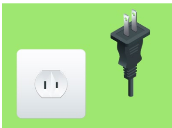
Tipo A: Tiene dos clavijas planas y paralelas.

La tensión eléctrica en Perú es de 220V y los enchufes del país son del A/B y C.